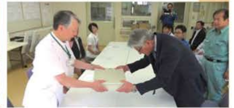
新病院 鍵の受け渡し