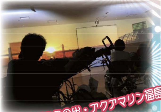
小名浜の日の出・アクアマリン福島