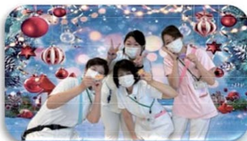
【新しい外来のリーダーズの皆さん】

QC活動は常日頃の業務で忙しい中、解決に向けて考え、勇気をだし、工夫しチームで解決していくことで職場が活性化していきます。これからも楽しみながらQC活動を実践し継続していきたいです。サークルの皆様、1年間の活動お疲れ様でした。